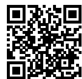
連絡メール2 保護者ログイン

* 保護者サイト https://renraku.education.ne.jp/parent/