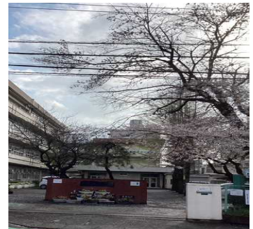
【石碑と花々に迎えられる正門】

本校は、明治6年の開校以来、明治、大正、昭和、平成、令和と激動の時代を過ごすなか、大勢の卒業生と地域の皆様に見守られ歴史と伝統を築いてきた学校です。敷地内にある様々な施設、石碑、根をしっかりと張った木々は子供たちを見守り続けてくれています。また、敷地周辺や通学路においても多くの皆様のお心遣いを感じています。本校が充実した教育活動が出来るのもこのようなお支えがあっての事と感じております。