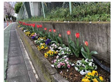
【きれいに咲きそろう花々】

から4年を迎え、一人一台支給されているタブレット端末を使った学習も日常となってきました。これまで積み重ねてきたことを大切にしながらも、今と未来を生きる子供たちのために、教職員が一枚岩となって、児童一人一人に確かな学力・豊かな心・健やかな体をバランスよく育てまいります。保護者や地域の皆様のこれまでと変わらぬご支援・ご協力を何卒よろしくお願い申し上げます。